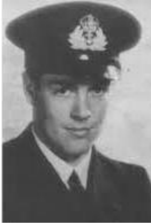
Sir Samuel Falle (1919–2014)