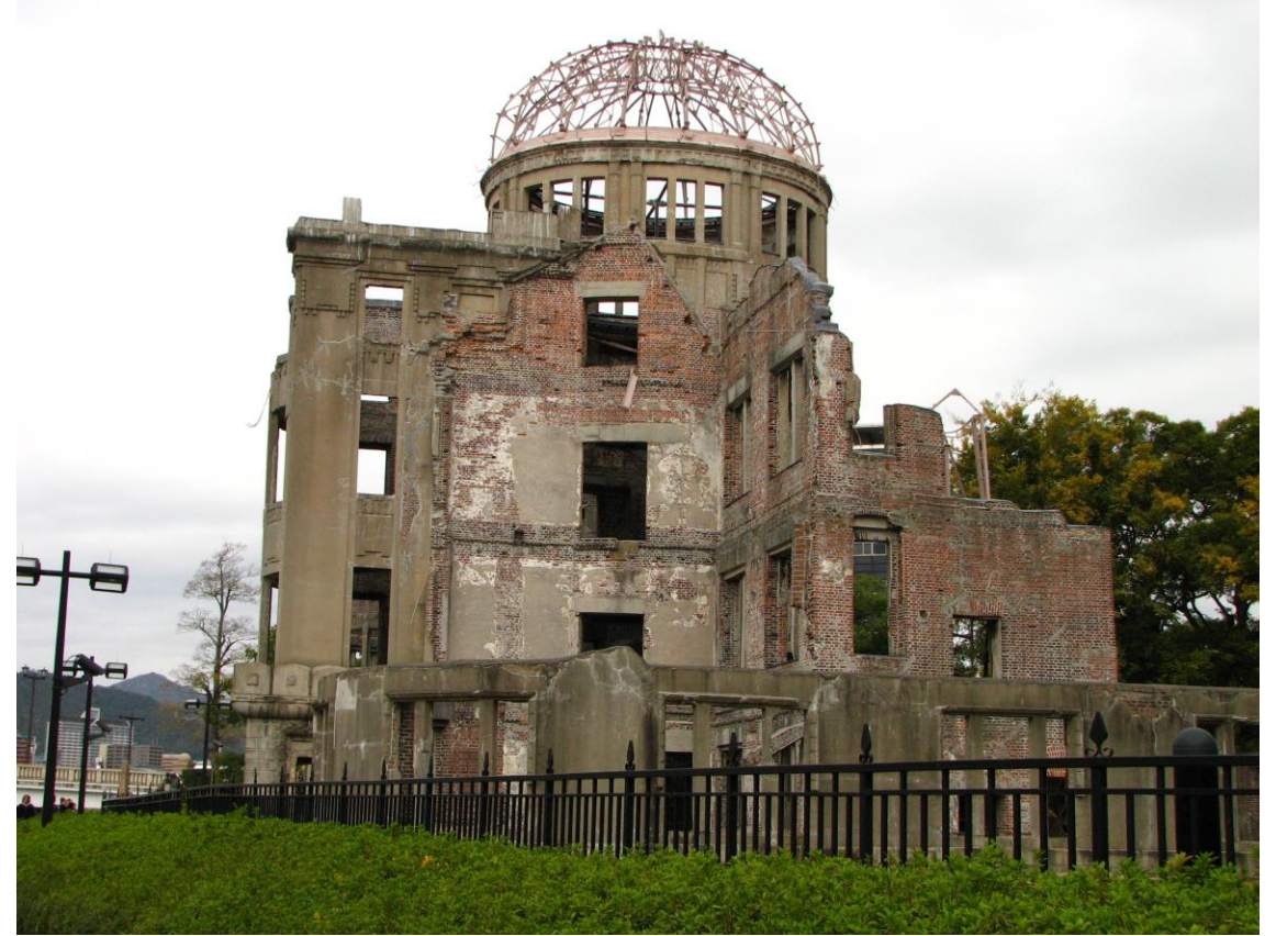
Atomic Bomb Dome (Japan)