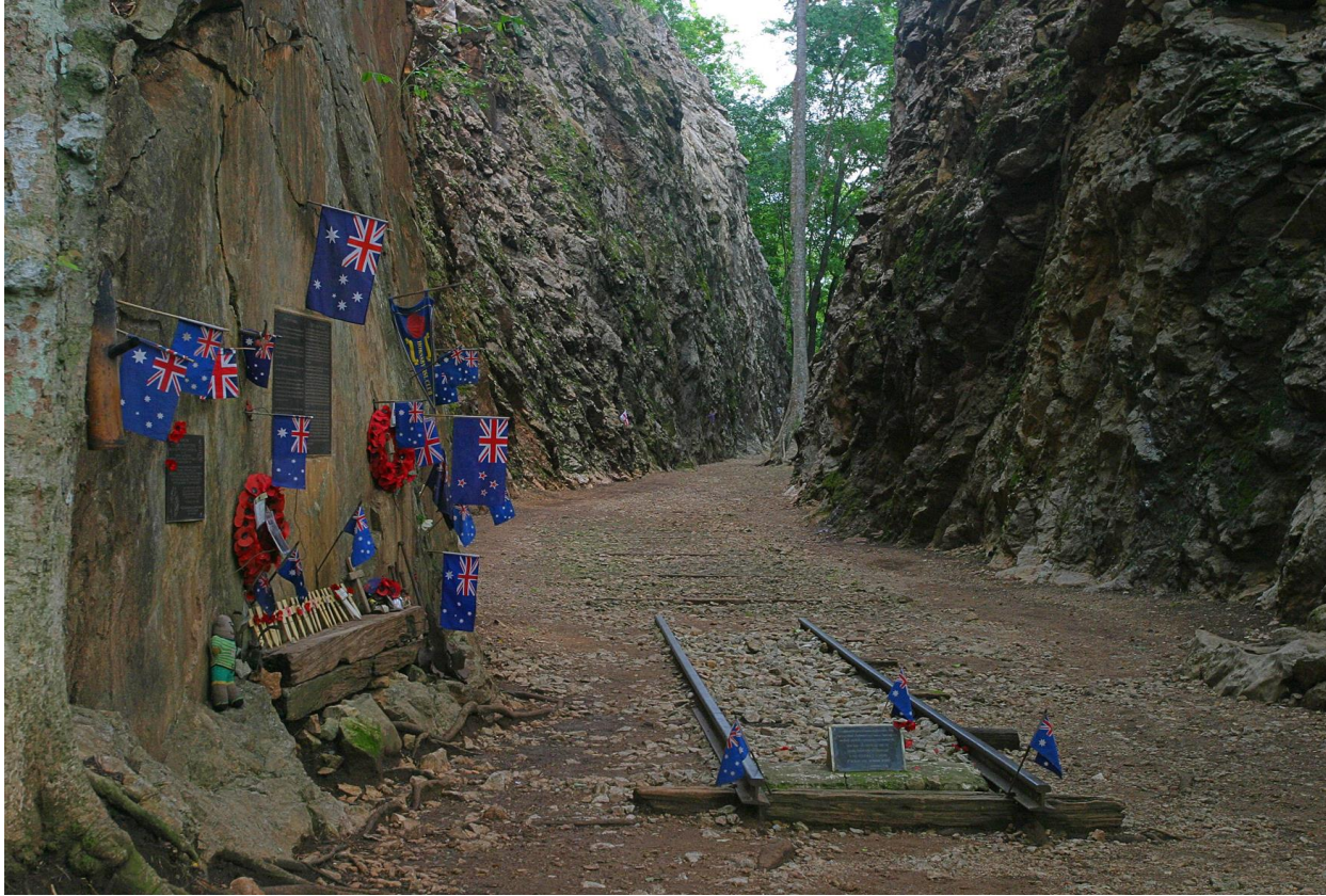
Siam-Burma Railway (Thailand)