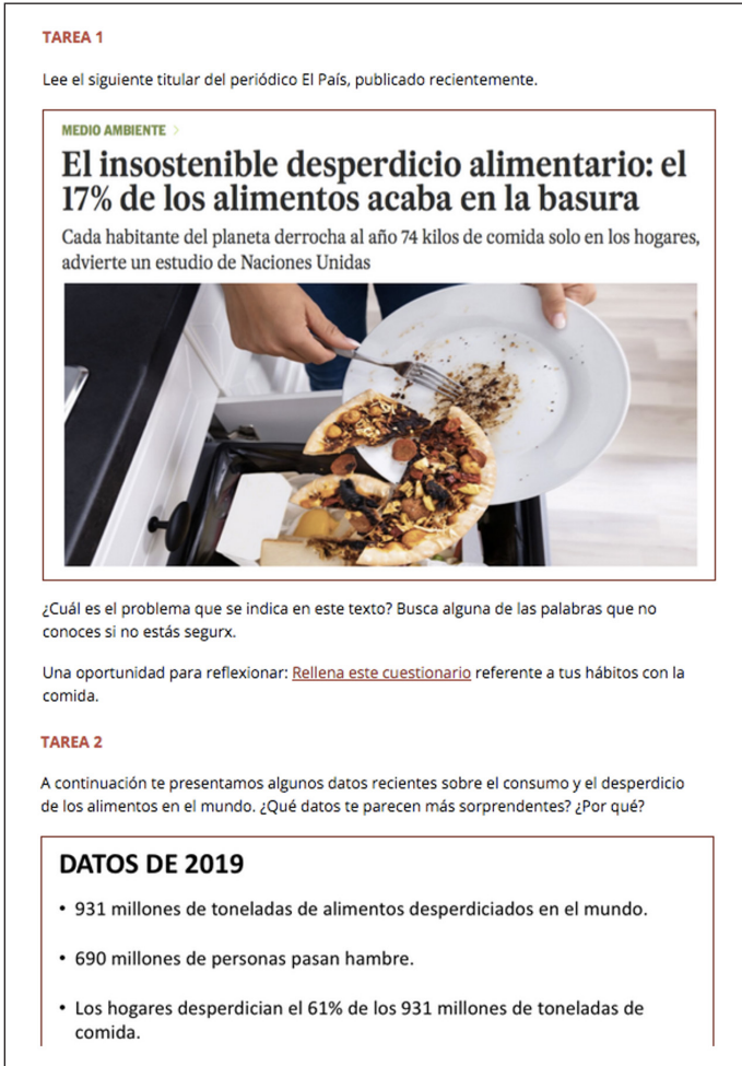
Figura 4. Vida sostenible: Alimentación sostenible , es un tema que puede trabajarse a diferentes niveles y que incita a reflexionar sobre los hábitos de consumo personales además de su impacto más allá de nuestro entorno más inmediato (Arribas-Tomé, 2021)

En la Figura 5 pueden apreciarse los nombres de los estudiantes que, al hacer uso de los materiales, desarrollaron conocimientos y competencias para