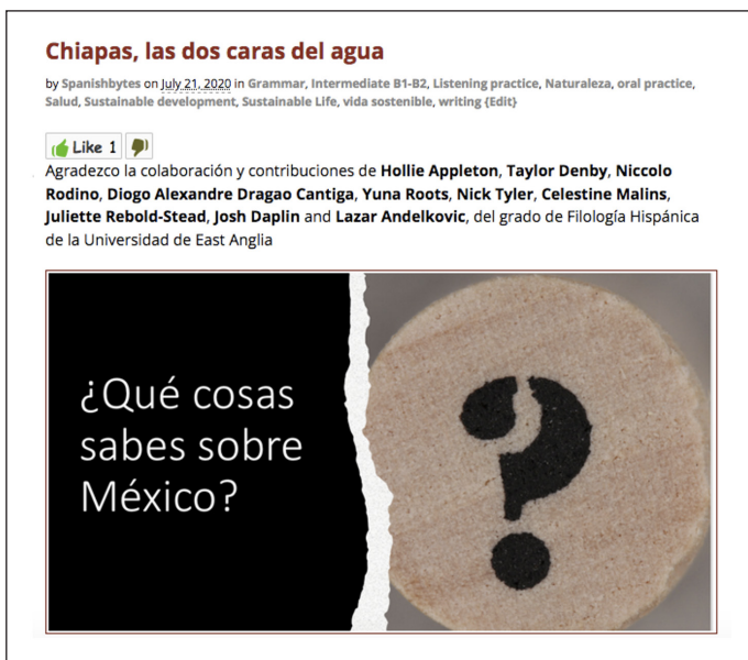
Figura 5. Haciendo visibles a los estudiantes y sus contribuciones ( Arribas-Tomé, 2020b )

abordar los desafíos sociales a través de la reflexión y la escritura. Generaron textos y otras aportaciones que fueron añadidos al material inicial. Siguiendo el trabajo de Mercer-Mapstone et al. (2017) se reposicionan “las funciones de los estudiantes y del profesorado en el proceso de aprendizaje, sobre la base de una ética basada en valores” y “los académicos informan de una transformación del sentido de sí mismos y de la conciencia de sí mismos tanto para los estudiantes como para los profesores” (p. 2). La participación de los estudiantes se convierte así en colaboración, y su trabajo en cocreación de contenido; pasa a ser visible y a adquirir un valor que no está asociado a un resultado numérico. La página web se convierte de esta forma en un espacio donde las relaciones de poder y subordinación, profesor-estudiante, se eliminan sustituyéndose por otra relación, más experimental e igualitaria. La actividad de los estudiantes genera un excedente cognitivo que no se pierde sino que enriquece un espacio virtual en constante transformación y accesible a todos.