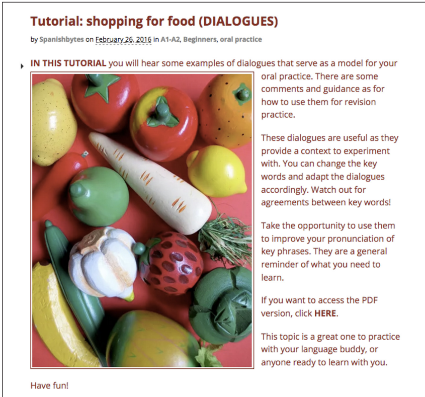
Figura 1. Ejemplo de material de apoyo al estudiante para su práctica autónoma (Arribas-Tomé, 2016)

“Sostenible” (Merriam-Webster 7 ) se define como “capaz de ser sostenido o capaz de durar o continuar durante mucho tiempo”, también “capaz de ser utilizado sin ser completamente agotado o destruido” y “relacionado con un estilo de vida que implique el uso de métodos sostenibles”. Lexico Dictionaries 8 complementa estas definiciones con “capaz de mantenerse a un cierto ritmo o nivel” y “capaz de ser defendido”. Podemos comenzar evaluando si la enseñanza de idiomas se